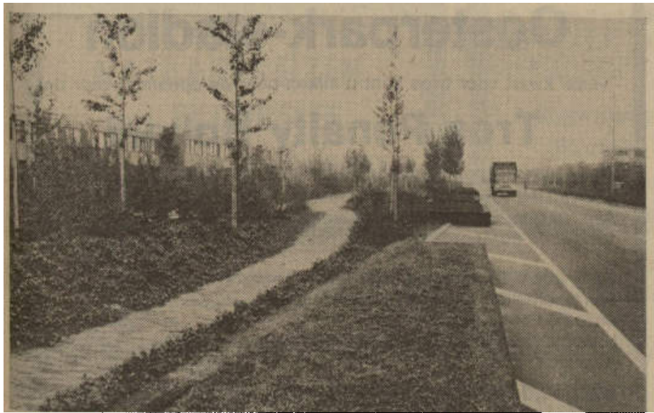
Het werk van de gemeentelijke plantsoendienst in Lewenborg.