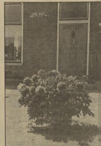
De ploerros mag in geen enkel boerentuintje ontbreken. De plaatselijke benaming is "potroos" en de foto uit Eelde bewijst waarom.

geld hadden. Bovendien hadden de boerinnen natuurlijk een eigen voorkeur".