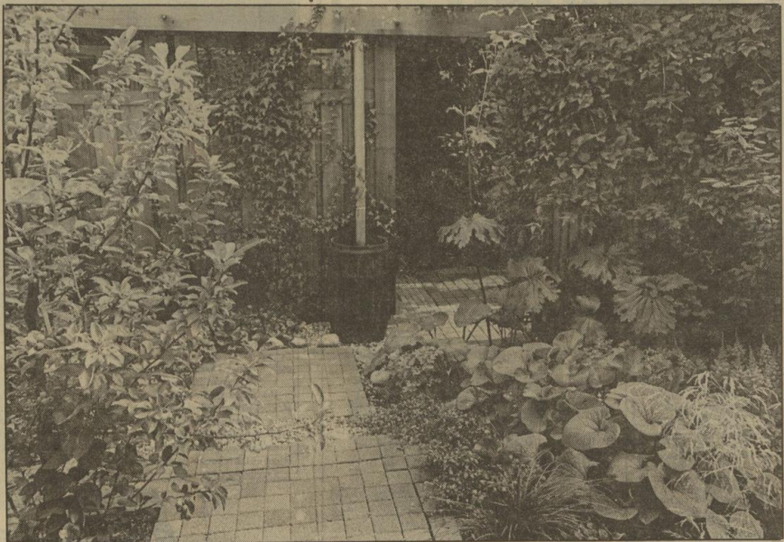
Een tuin moet passen bij het huis en de omgeving...

viser ik vaak een terras, een vierkante of een rechthoekige vijver of een strakke haag. Een schutting kan ook wonderen doen. Zulke rustpunten zorgen ervoor dat ook de verschillende planten beter tot hun recht komen", meent Veldhoen die in het algemeen een eenvoudige vormgeving propageert.