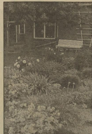
Een boerentuintje in Belien. Niet helemaal aangelegd volgens het oeroude patroon, maar de traditionele planten zijn er nog wel. Zoals de duizendschonen, papavers, viooltjes en anjers.

De boer bemeste de tuin en de boerin onderhield op zaterdag erf en tuin. In zo'n siertuin stonden geen siergrassen, heideplanten of coniferen. Wel een stokroos, pioenroos, de daglelie en een akleli. En op het stookhok groeide een pol huislook. Dit om onweer te bezwaren. Omdat per streek de grond verschillend waren de boerentuinen niet allemaal gelijk. Ook aan de tuin kon je zien of mensen geld hadden of niet. Een tuin met veel buxus - een duurder plantmateriaal - gaf aan dat de boeren