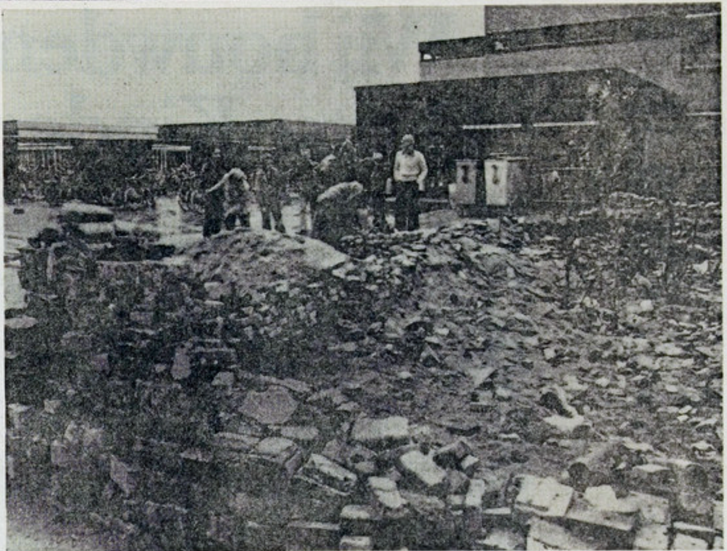
★ "Ik ben gekomen om te metselen, dus metsel ik".