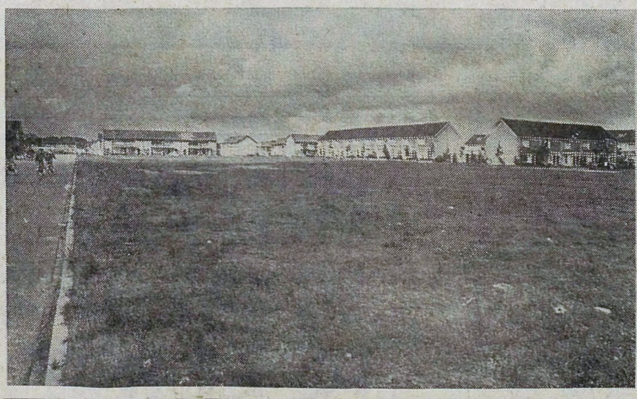
● BERGEN OP ZOOM: Een getuigd terrein om wat terug te doen tegen de voortwoekerende dodelijkheid van rijtjeshuizen op de achtergrond.