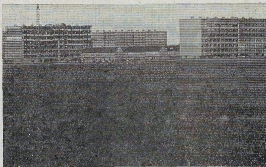
● TERNEUZEN: Uitbreiding, die het landschap steeds verder opvreet. De natuur moet ook hier nodig in de aanval.