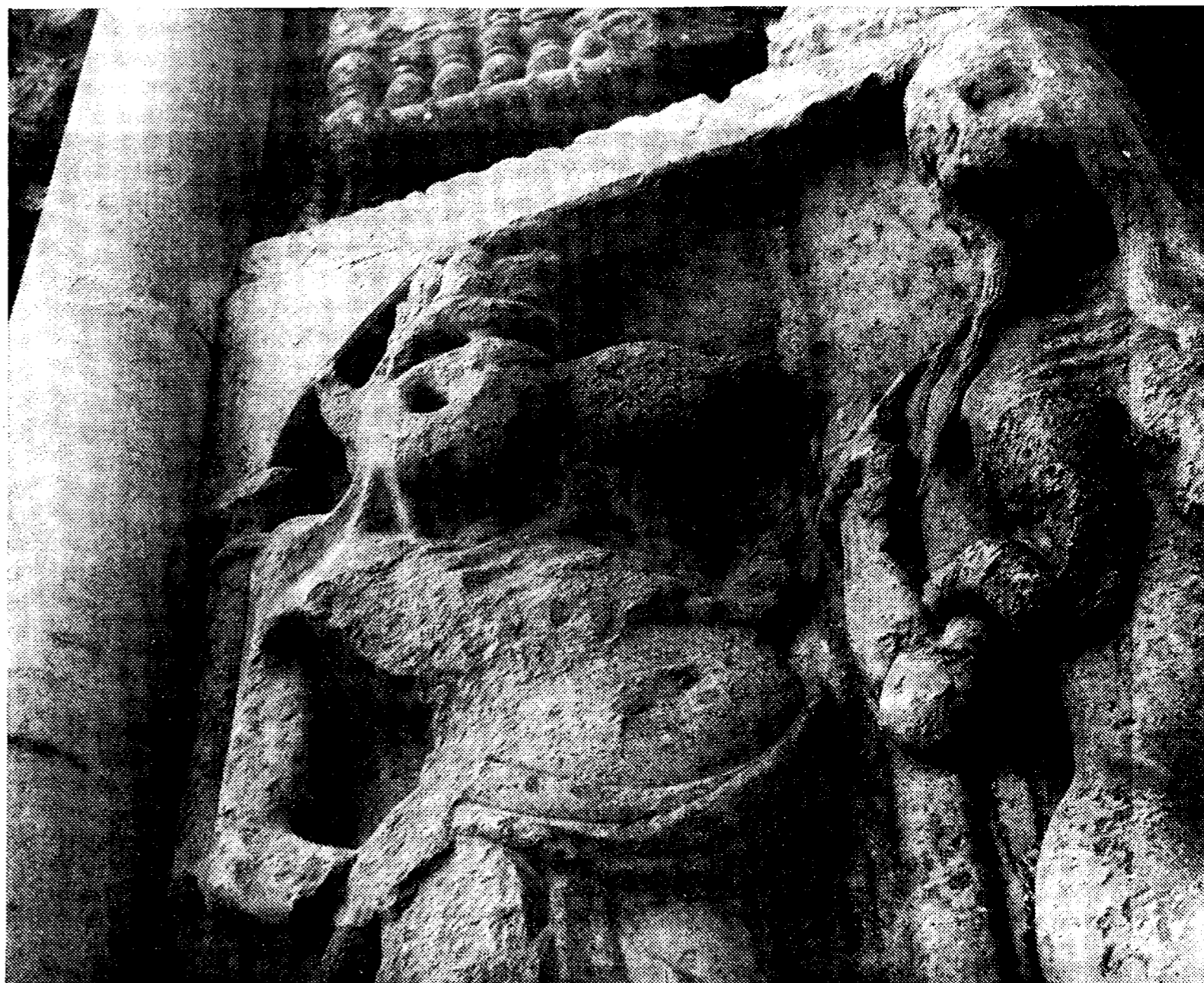
MOISSAC; een voorportaal, ± 1150, — „...met heel krachtige hand was er een satyr uitgehouwen...”

Onder het enorme gewelfde voorportaal gaan vrij de kolossale ruimte binnen. Enkele arbeiders slechts hangen als gewichtloze insecten in deze grijze grauwe kerker. Door golvende plastic platen valt het licht blank naar binnen. Als een dominantie in een kale woese-