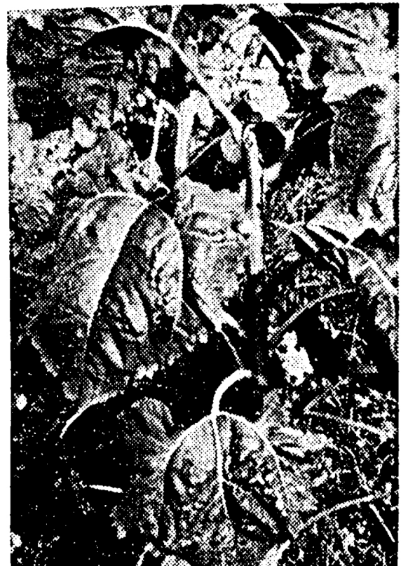
● Deze stengel mist zijn zonnebloem al.

Het bezorgde wijkraadslid had de indruk dat de roofzuchtigen vooral van buiten Lewenborg kwamen. Dat klopte rond half vijf ook nog: de mensen die zich van de grootste buit hadden weten te verzekeren, reden de wijk weer uit. De Lewenborgers zelf waren meest lopend. Sommigen hadden ook grote bossen bloemen bij zich. Maar dat zijn dan ook altijd nog de bloemen die ze zelf op een natte mei-