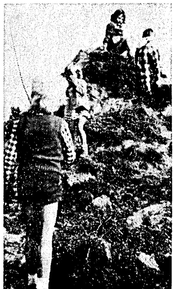
● Spelen op een Le Roy-heuvel.

Amateur-fotografen speurden er rond en draaiden hun lens scherp op een bloem-met-bijtje. Kinderen speelden glijbaantje vanaf de Le Roy-heu-