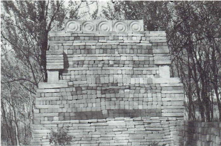
Fragment van de eco-kathedraal in Mildam