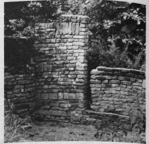
van een klein detail van de mantelarchitectuur...

recte gevolg van de bezoeken van Ruhnau was dat mij werd gevraagd om in verschillende Duitse steden gastcolleges op universiteiten te komen geven. Ik was echter veel meer verheugd over het feit dat het moeizame werk, dat jarenlang door groepjes vrijwilligers was verricht, tenslotte die waardering had gevonden, die het niet alleen verdiende maar die ook noodzakelijk was om nog jarenlang verder te kunnen werken.