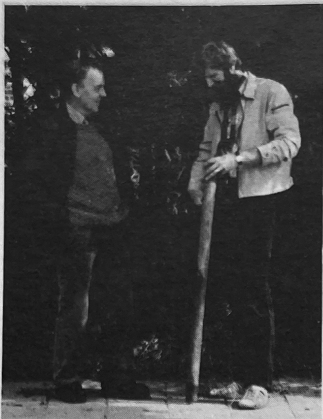
...bespreekt de 'tuinspecialist' uit Oranjewoud (links) met één van de medewerkers...