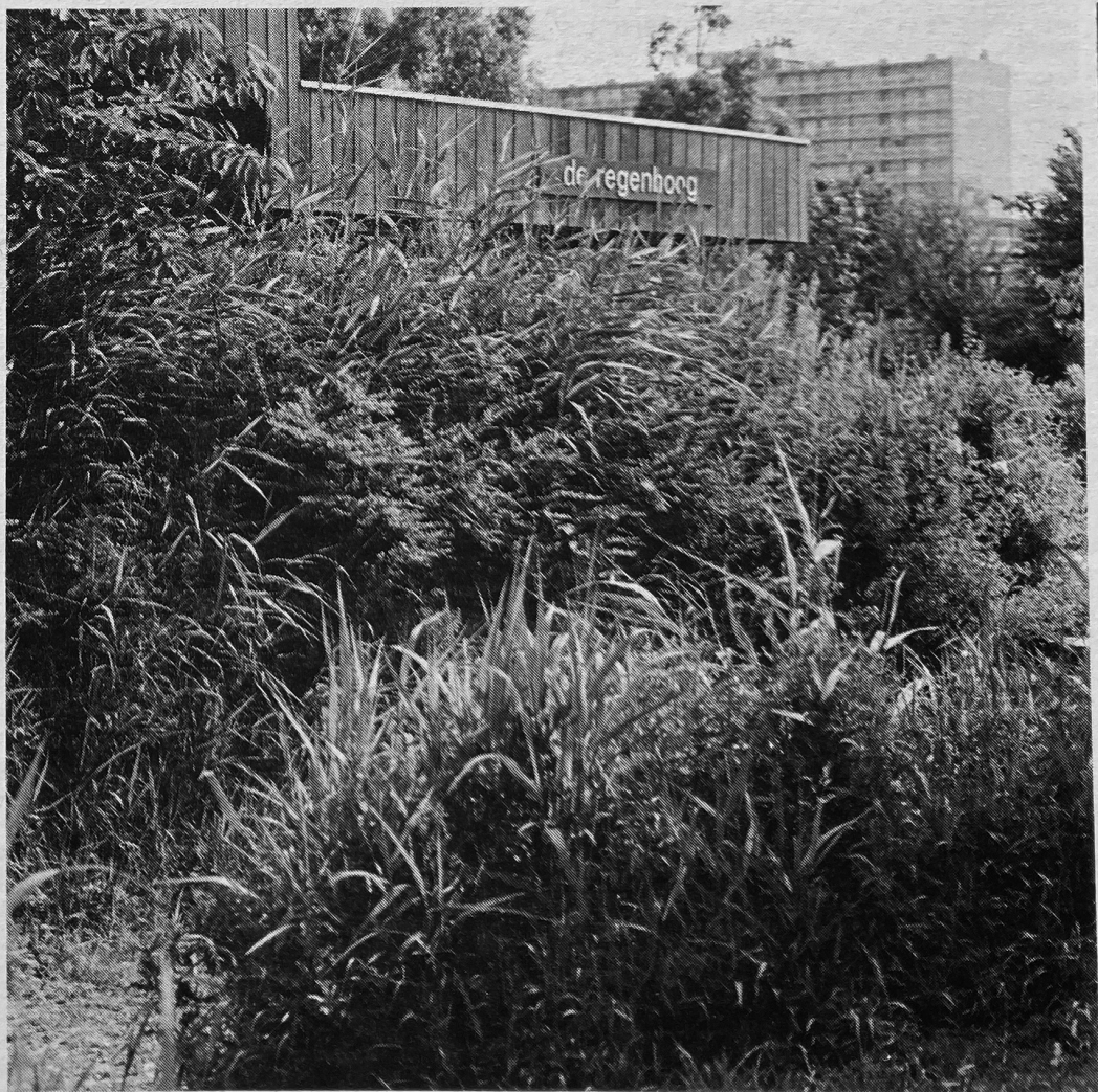
voor de 'Regenboog' (teken van het verbond), gehuld in een feestgewaad van groen,...

Ruhnau bleek onvermoeibaar als het er om ging zijn reisgenoten duidelijk en klaar te vertellen waarom hij deze ontwikkeling met zoveel belangstelling bleef volgen. Het di-