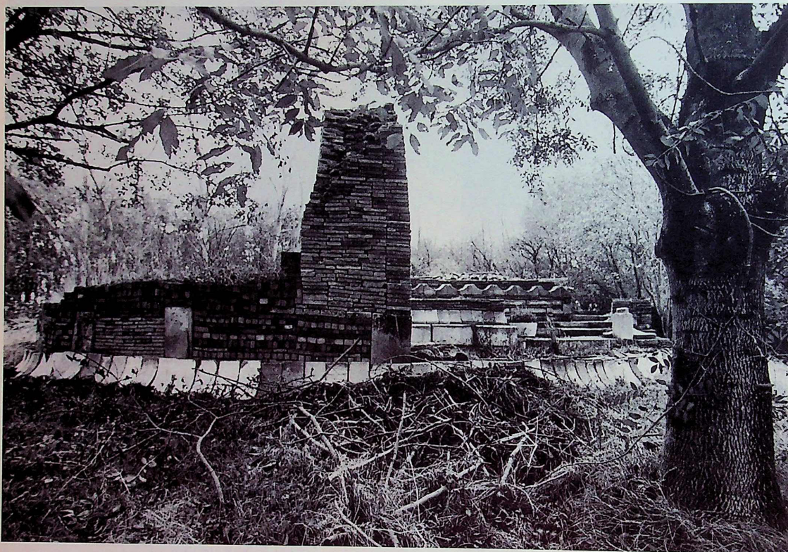
Het indrukwekkende bouwwerk bestaat ondermeer uit grote rechthoekige torens en diverse verdiepingen.

'Wij maken steden tot stieriele gebieden, waar alles vastligt; huisje en boompje hier en een gebogen stukkie ijzer – een kunstwerk – daar. Voor de politiek is