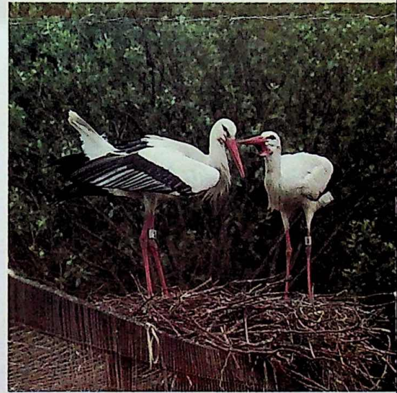
De ooievaars van Eernewoude

glazen voorwerpen, maar elk paneel kan ook worden gezien als een op zichzelf staand spel van kleuren en lijnen. Als het aan Le Roy ligt gaan de doeken in willekeurige pakketten rouleren tussen tien musea, waarna het geheel weer bijeenkomt voor een totaalexpositie in een ijsstadion. "Als je het eerste paneel hebt gezien word je nieuwsgierig naar het volgende. Zo raken mensen in de loop van enige jaren betrokken bij het beeldend proces. Schilders leveren altijd