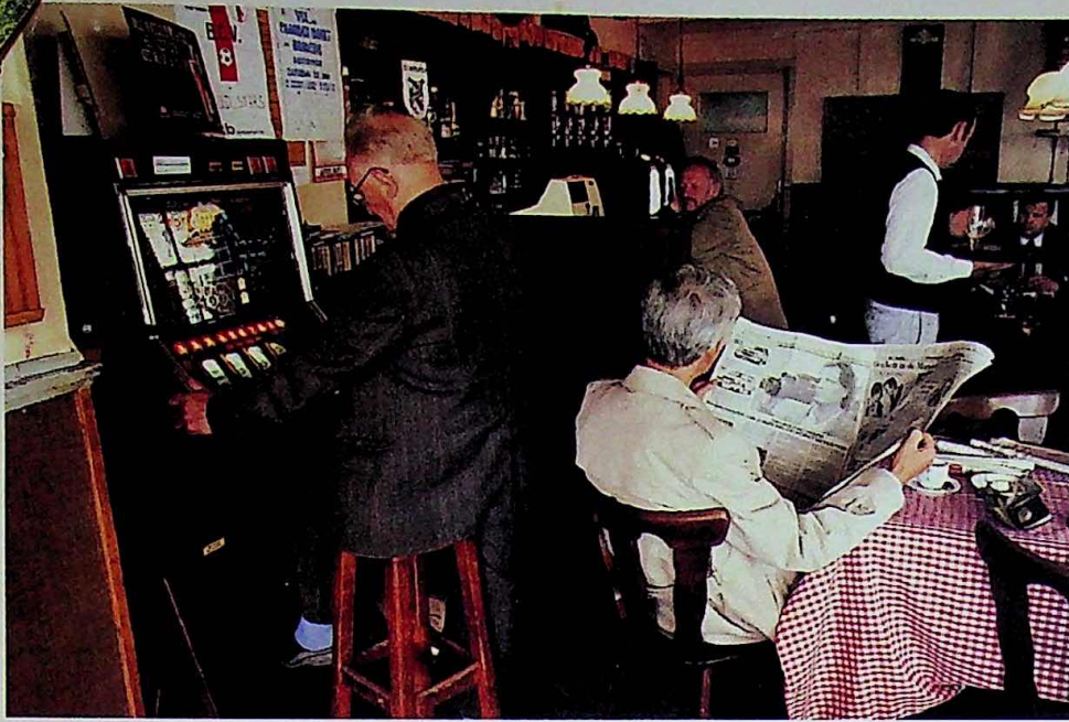
▲ Café De Drie Gekroonde Baarzen