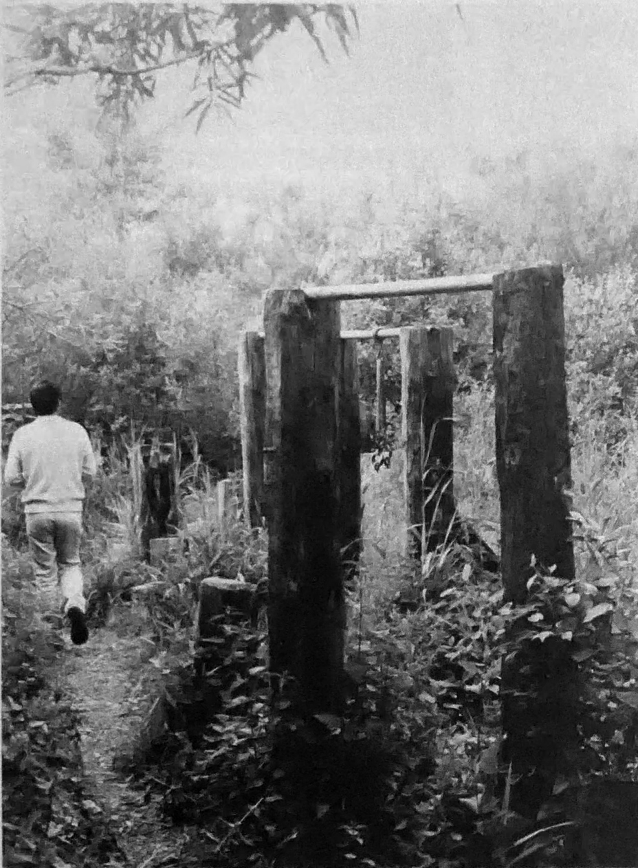
Speelelementen uit de beginfase van Lewenborg die nu niet of nauwelijks meer worden gebruikt