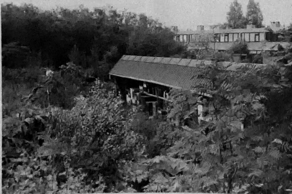
De bijenschans is door de bewoners zelf gebouwd. Beplantingsideeën komen mede voort uit de behoefte aan drachtplanten voor bijen

De activiteiten van de bewoners in de wijk Oude Weide in Leeuwarden heeft een wat andere achtergrond. „Jarenlang zijn we in de weer geweest om de woningen te renoveren, die op de nomi-