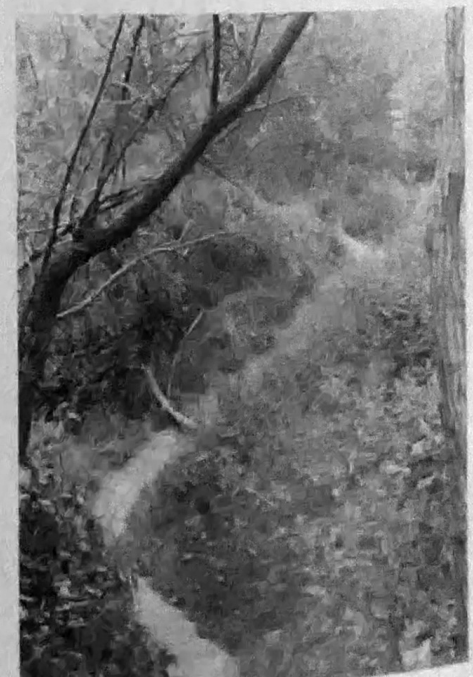
Een wilgenbosje was het eerste wat in het Le Roy-gebied werd aangeplant