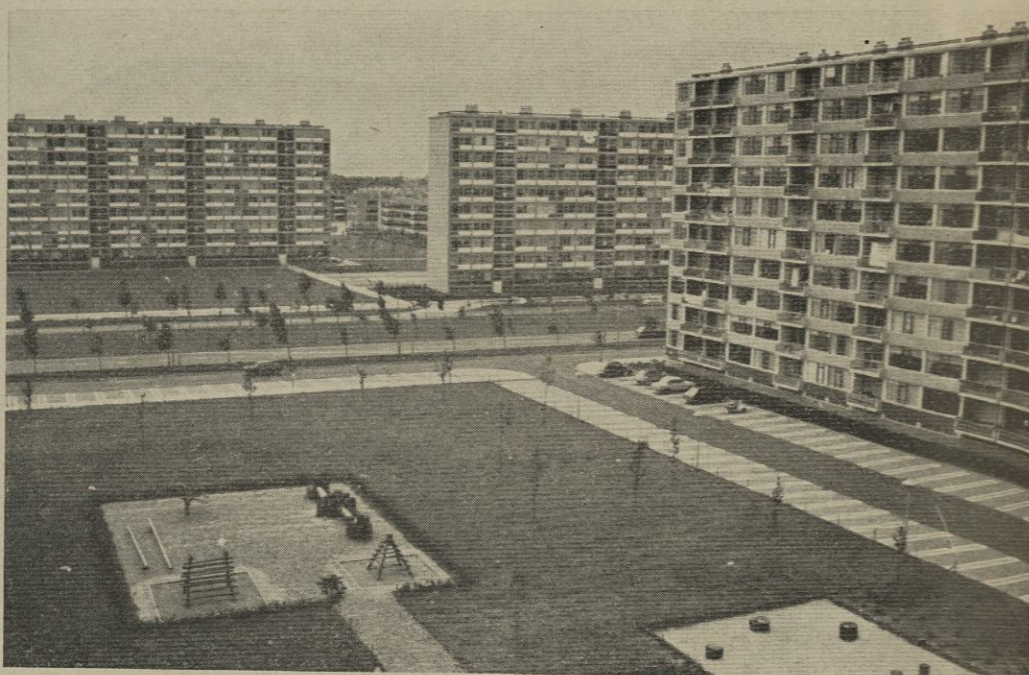
'Woonbroden' in de Utrechtse wijk Overvecht.

Werkgroepen uit de bevolking zouden volgens Van Lunteren als volgt kunnen functioneren: „Uit de ideeën en suggesties van de bewoners wordt een program van eisen opgesteld, waarbij mogelijkheden en onmogelijkheden zijn aangegeven. Ik denk hier aan de ligging van