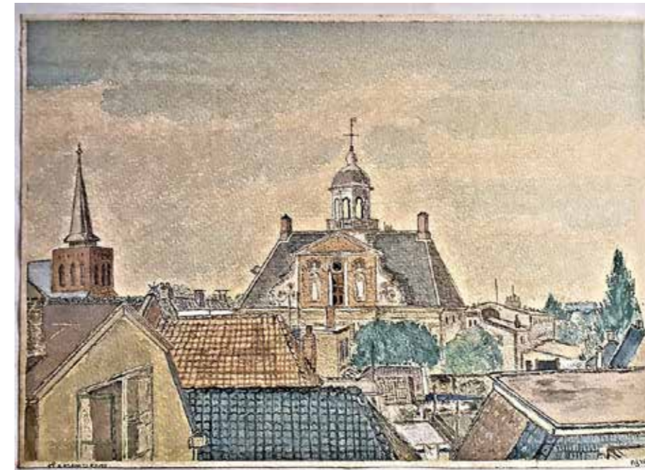
Aquarel gemaakt door Ys Sevensma, vlak voordat hij verhuisde naar Amsterdam

Bij de sloop in 1972 van de Schoterlandse Kruiskerk, die tegenover het Posthuis Theater stond en waar nu de fundering