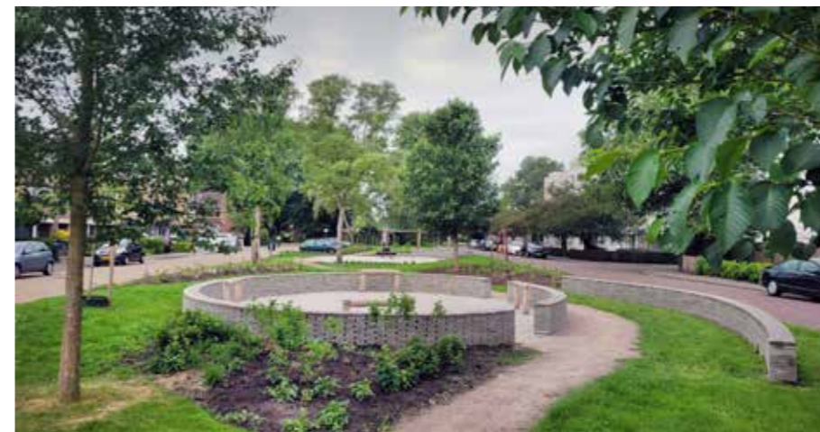
Het grasveldje aan de Jan Mankeslaan werd een heuvelachtige terrein met veel begroeiing en gestapelde tegels.