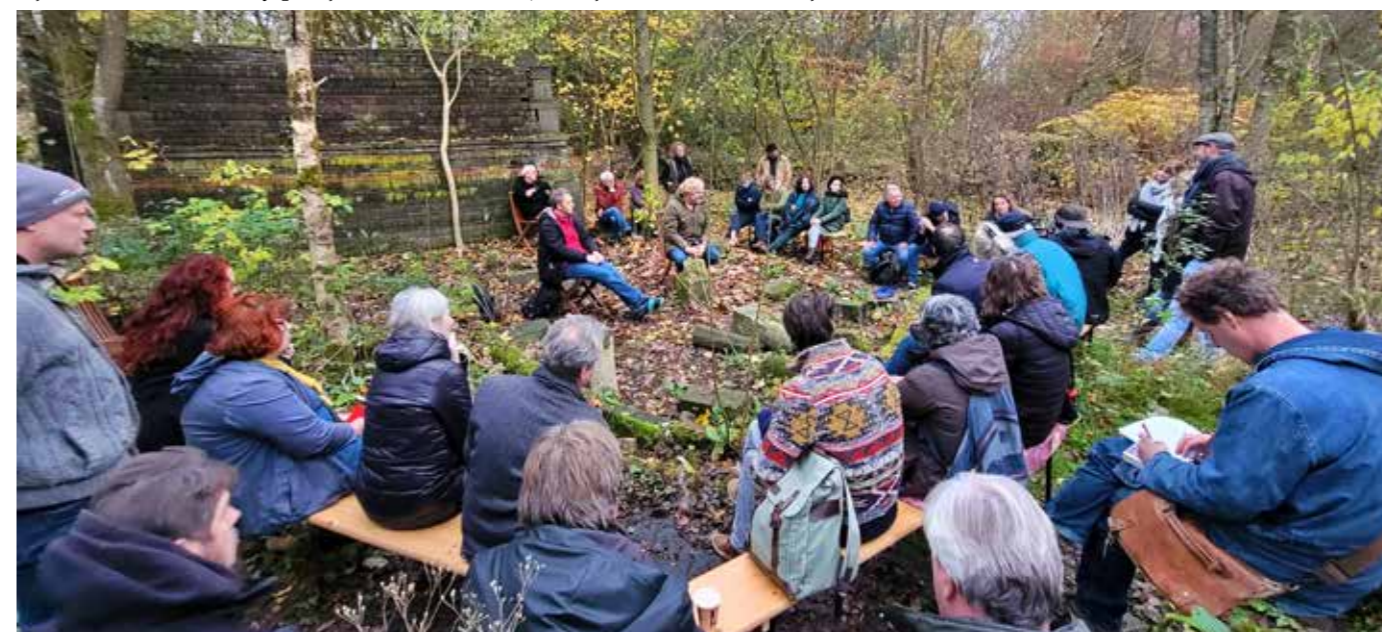
Bezoek van de schrijver Roman Krznaric aan de ekokathedraal in Mildam en Heerenveen op 21 november 2021