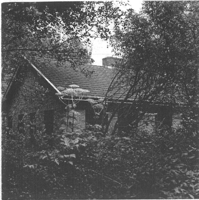
mijn atelier, na een periode van nauwelijks twintig jaar, nu temidden van een weelderige dynamische vegetatie in een 'nieuw landschap'