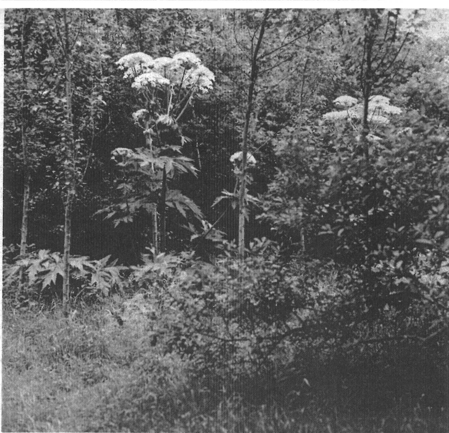
...of het gras is snel verdwenen dankzij de breed uitstrelende bladeren van de grote –wit bloeiende– reuzenberenklauw: een exotische agressieve woestelling die echter makkelijk kan worden bedwongen wanneer de grote bloemschermen, na de bloei, direct worden verwijderd