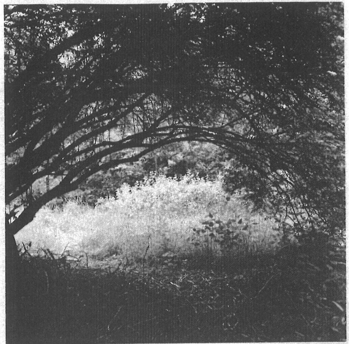
het steriele grasland dat hier eens gelegen heeft is plaatselijk óf door machtige, tot op de grond doorbuigende, vlieren geheel verdwenen en heeft daar plaats moeten maken voor een 'romantisch' landschap...