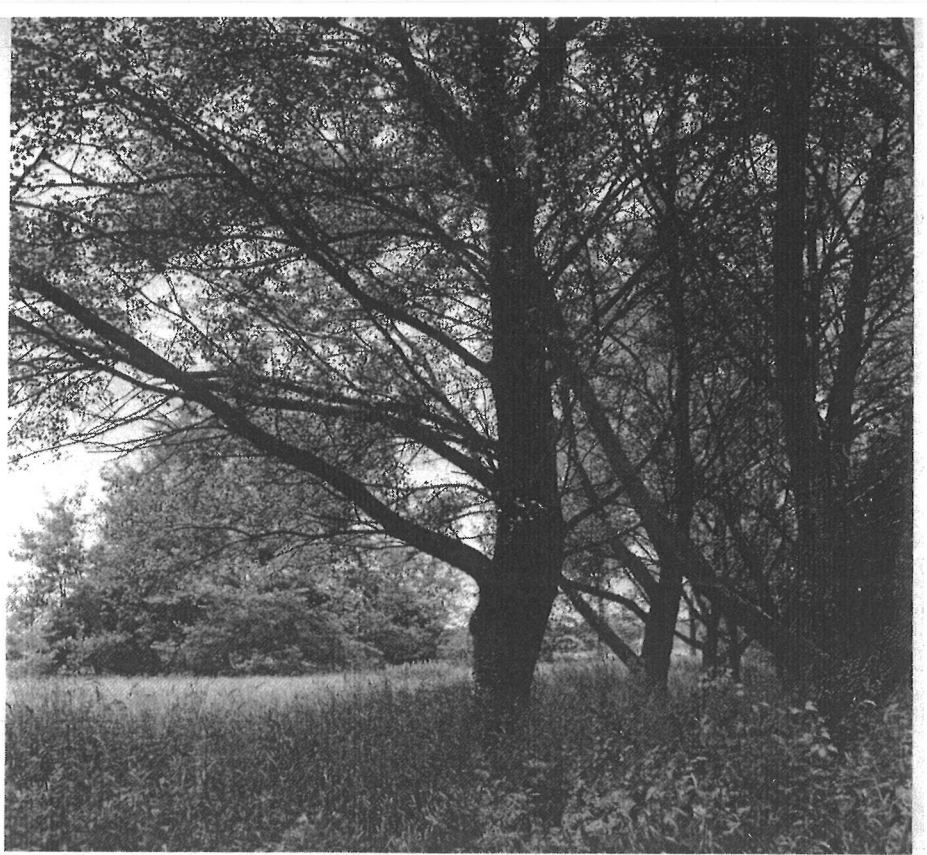
beschermd door hoge populieren en breed uitgegroeide, huizenhoge abelen staat—op een ongeveer twee hektaren groot terrein even ten zuiden van Heereveen—

Meer bij de tijd dan Wiegiersma zich in zijn beschouwing lijkt te presenteren, reageren in Garten und Landschaft 5/1983 Spalink en Entrup-Randl met een gedegen beschouwing over Internationales Wettbewerb Parc de la Vilette. Zij eindigen hun bijdrage in dit vaktijdschrift voor tuin- en landschapsarchitecten met de nuchtere opmerking dat nu juist Bernhard Lassus tot de weinigen gerekend dient te worden die met zijn beide benen auf dem Boden der Realität gebleven is! Lassus was er in geslaagd om een redelijk plan in te dienen, waarmee hij slechts dat planmatig wilde ordenen wat met het stedenbouwkundig aspect van de omgeving van het nieuwe park la Vilette te maken zou hebben, daar dat voor het grootste deel ter discussie met het volk zou staan. En daarom hadden deze Duitse critici nu juist zo'n grote waardering voor Lassus, omdat hij zich zo min mogelijk aan het programma van de prijsvraag had gehouden; dit zou wel eens de eerste belangrijke stap geweest kunnen zijn op een weg, die er toe zou moeten leiden om het juiste begin van een goede ontwerp methode te kunnen ontdekken.