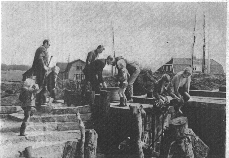
Project Sjanghaldreef in Overvecht, Utrecht (zie pag. 64)