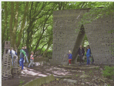
Het bouwwerk 'De Poort' in de ecokathedraal van Mildam is indrukwekkend, maar hij is niet gebouwd zoals Louis le Roy te werk ging, 'het is namelijk een af-ding'.