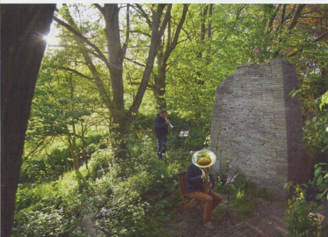
Gebruikmaken van wat er voorhanden is aan materiaal, kennis en energie: dat betekent ook het op initiatief van omwonenden laten plaatsvinden van dansvoorstellingen en muziekfestivals in de ecokathedraal.