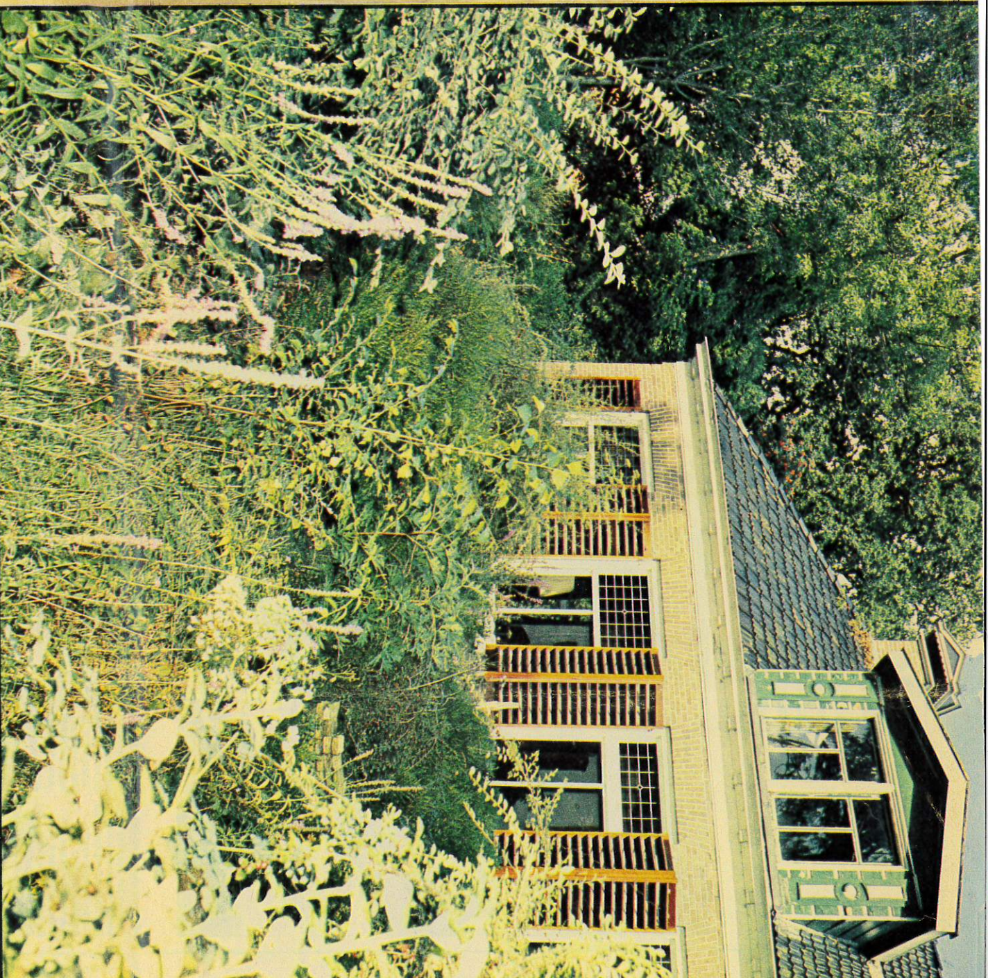
De tuin van Le Roy in Oranjewoud: zeshonderd plantensoorten rondom het huis, 'een tuin ligt nooit vast, het verandert steeds.'

en uit de grond verdween. De aanslagen, op de natuur gepleegd, waren te massaal geworden. Het biologisch evenwicht kon niet meer hersteld worden. De natuur kon niets meer terugdoen, want de natuur was dood.